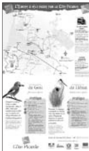
Une nouvelle signalétique pour ne rien manquer