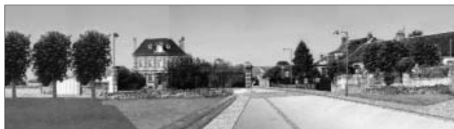
Esquisse de l'avant-projet, place de la commune de Ponthoile