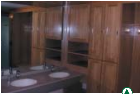
Aperçu des vestiaires hommes

L'augmentation des surfaces, une décoration chaleureuse ne peuvent que contribuer à l'amélioration du confort des joueurs.