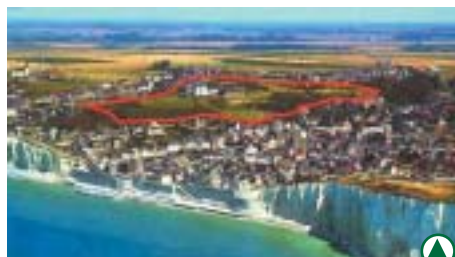
6,6 hectares dominant la mer

Ce projet s'intègre aux mesures d'accompagnement de l'opération de "Protection des zones urbanisées du Vimeu". L'acquisition sera réalisée par le SMACOPI. La commune d'Ault, le Conseil Régional de Picardie, le Conseil Général de la Somme accompagneront financièrement ce projet.