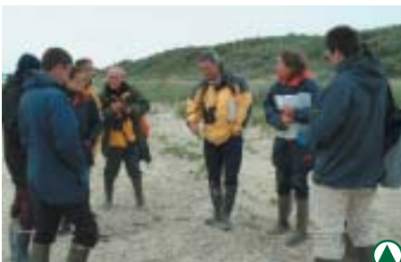
Le comité d'experts en discussion...

Un an après le passage au rotavator du site concerné, le comité de suivi s'est réuni pour examiner les résultats obtenus, tant en ce qui concerne