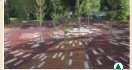
"L'espace des origines"