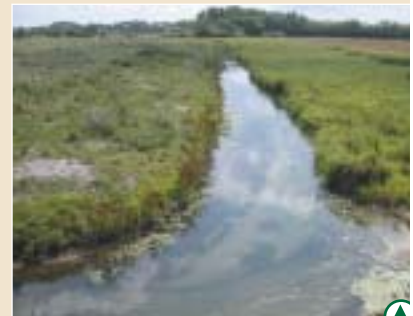
Le Dien, aujourd'hui

Les bénéfices attendus du projet sont une amélioration de la perception paysagère du fond de la Baie, une augmentation de la diversité des espèces végétales et animales, une meilleure maîtrise des niveaux d'eau en amont de l'écluse et une contribution au pacage des moutons de "l'Estran" grâce à l'accès à l'eau douce.