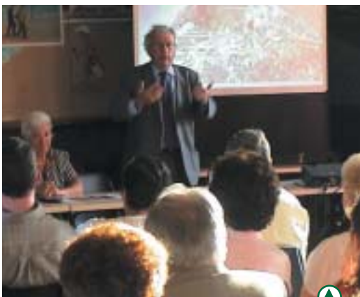
Réunion publique à Cayeux-sur-Mer

Cette opération pilotée par le Secrétariat d'Etat au développement durable a pour vocation de sensibiliser le grand public sur ses enjeux.