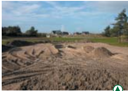
Mise en conformité du parcours

Cette modification semble aujourd'hui donner des résultats satisfaisants. Des plantations d'arbres sont venues compléter cet aménagement.