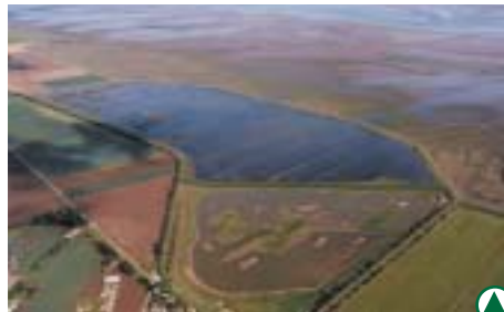
Le site de Freiston Shore

Le projet trouve son origine dans la difficulté physique et financière de gérer le trait de côte face aux assauts répétés de la mer. Une stratégie de recul maîtrisé a été mise en place tout en prenant en compte les effets attendus du réchauffement climatique. Afin de continuer à protéger la digue, derrière laquelle des espaces sont encore cultivés, un nouvel ouvrage a été construit en 2000, en isolant une partie du polder. Ce dernier a été édifié en trois couches afin de laisser le sol se